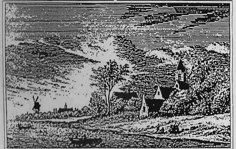
A. Kalmaker fecit